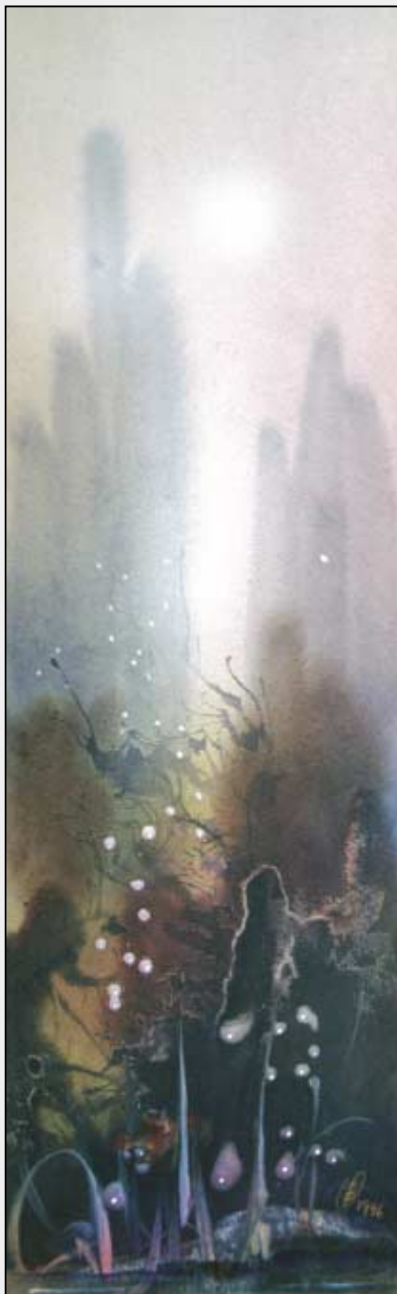
Из серии «Водопады»