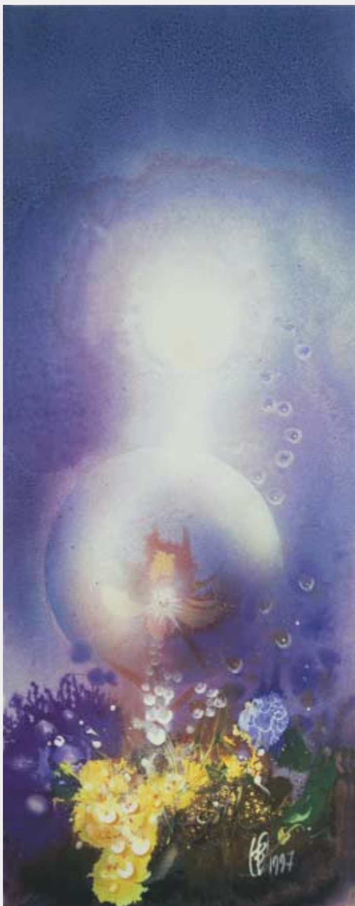
Из серии «Миры»

торый последовательно поддерживает и выявляет новые современные таланты.