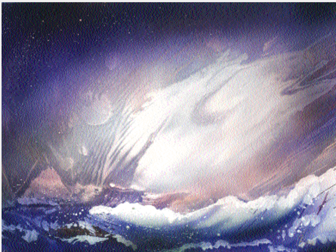
Из серии «Преображение мира»