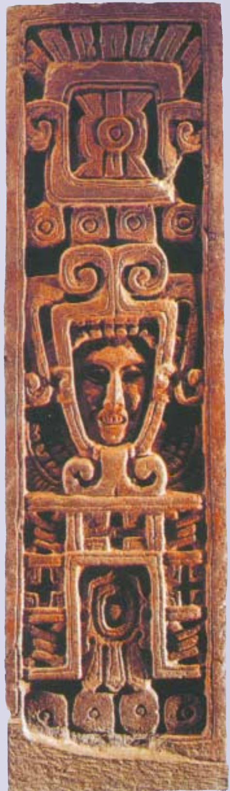
Стелла с изображением Кетцалькоатля. VI — IX в. Национальный музей антропологии. Мехико, Мексика

В более поздний период явление «дух-материя» становится основным вопросом философии, определявшим не столько ее суть, сколько «доброкачественность», критерием которой служил ответ на вопрос, что первично, а что вторично, дух или материя. Своей кульминации про-