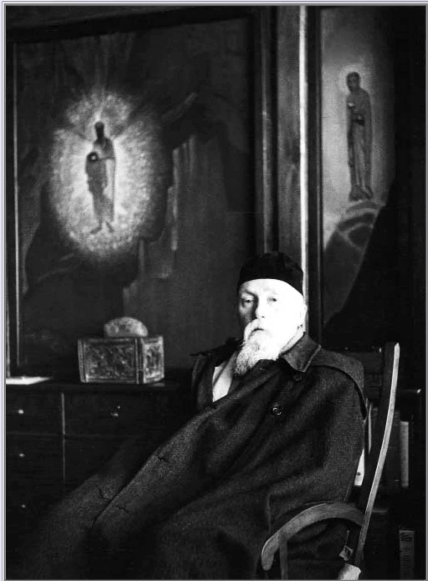
Н.К. Рерих у картины «Fiat Rex». Кулу, 1930—1940-е гг.