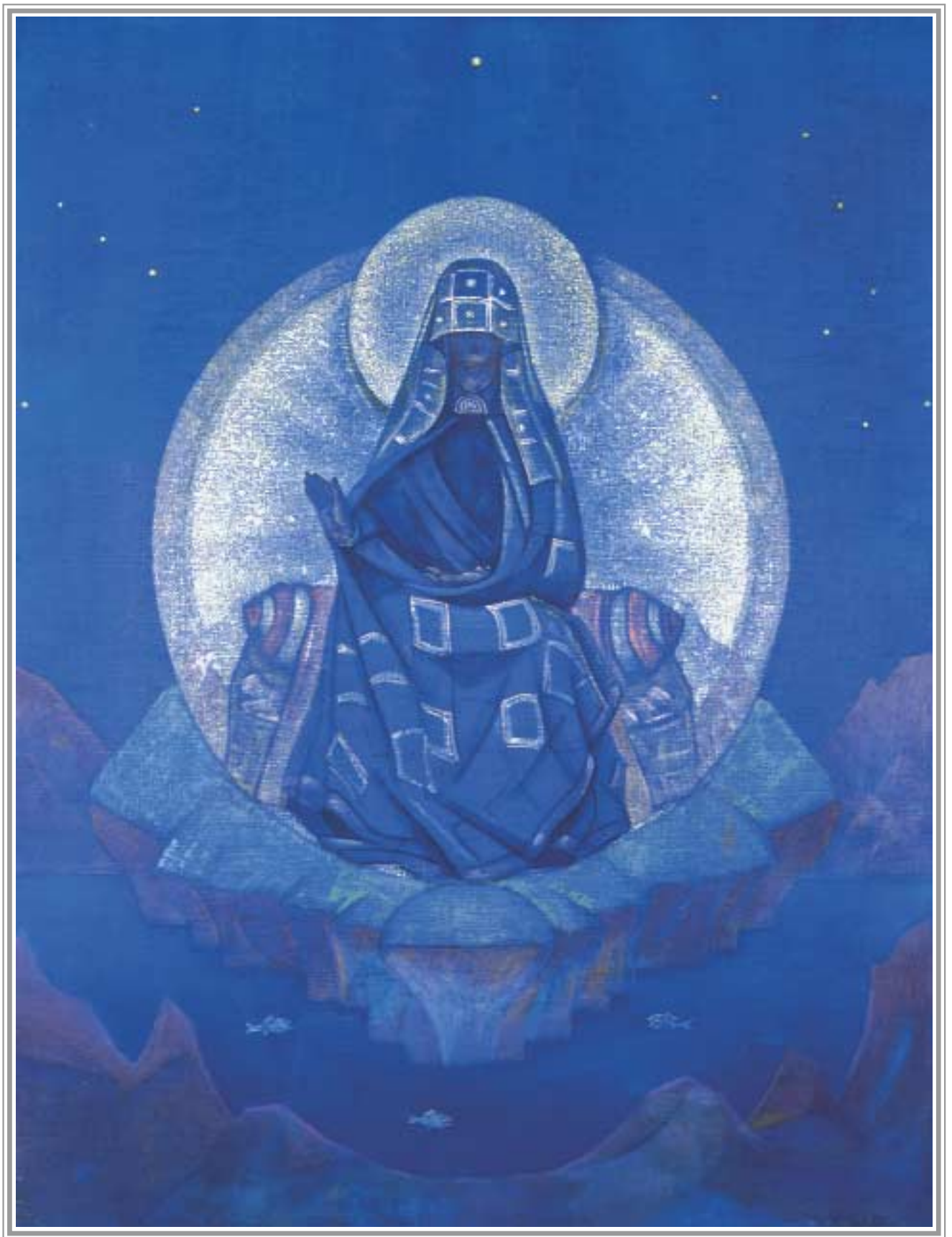
Н.К. Рерих. Матерь Мира. 1924