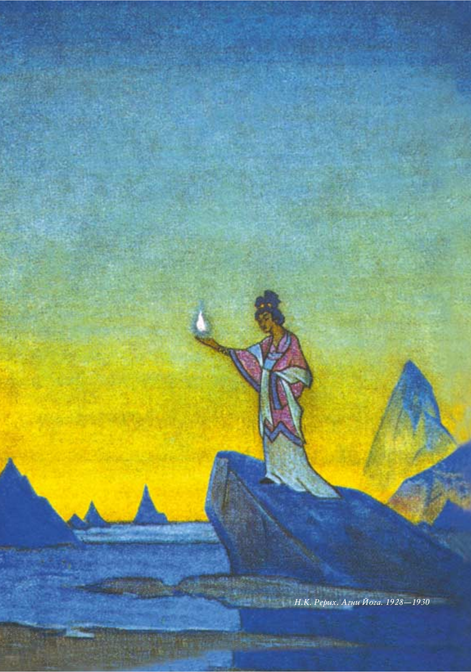
Н.К. Рерих. Агни Йога. 1928—1930