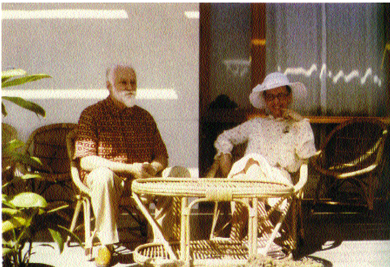
Людмила Живкова со Святославом Рерихом. 1981 г.

«Наша теоретическая мысль, — смело заявила она, — все еще не дала точного и удовлетворительного ответа на эти принципиальные вопросы, с позиции которого мы могли бы строить практическую работу по эстетическому воспитанию» 1 . И еще: «Имеется уже немало научных исследований, которые доказывают, что человек умеет ценить и создавать красоту во всех сферах своей жизни в такой степени, в какой он испытывает воздействие красоты и творит красоту в своей производственной деятельности. <...> Программа эстетического воспитания создаст все необходимые условия для гармонического развития личности, для проявления творческих способностей каждого члена общества» 2 .