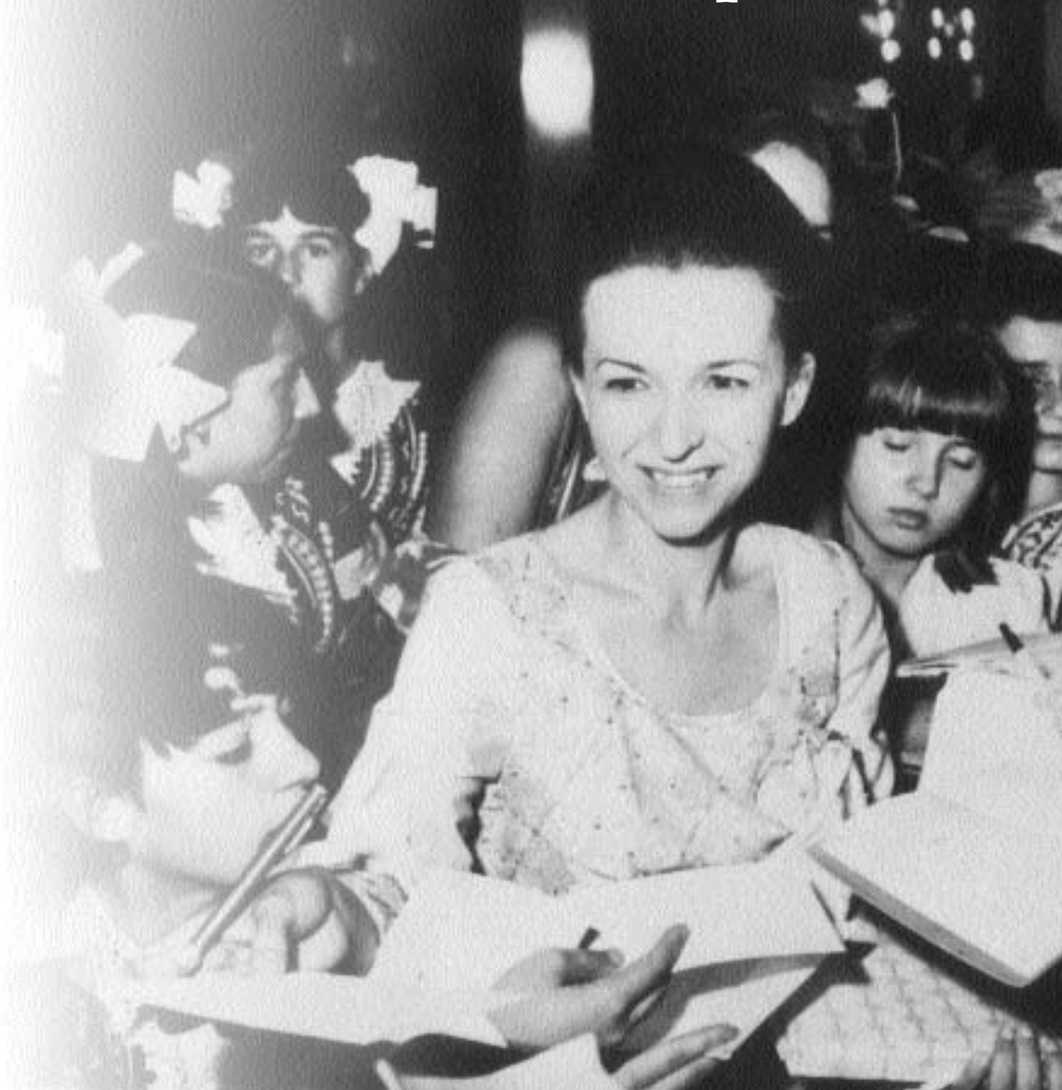
Людмила Живкова на Международной детской ассамблее «Знамя Мира». 1978 г.

В последние десятилетия жизнь человечества нашей планеты становится все более динамичной, напряженной, полной проблем. Политическая, социальная и культурная атмосфера, в которой протекает сегодня развитие разных стран и народов, обуславливает характер материальной и духовной среды, в которой происходит эволюция человечества на настоящем историческом этапе. Жизнь постоянно ставит человечество перед новыми испытаниями, определяются новые по своему характеру и тенденциям явления, параллельно протекает множество