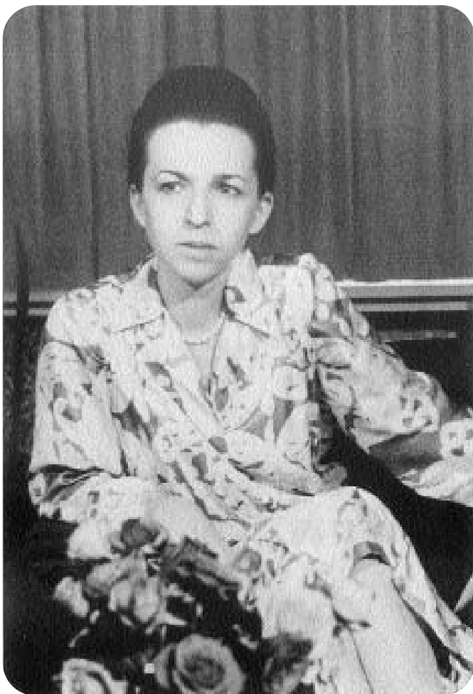
Людмила Живкова. 1979 г.

имя был наложен негласный запрет, и, казалось, кто-то невидимый и могучий держал этот запрет под строгим контролем. Среди моих собеседников были творческие работники, деятели культуры, ученые, но все они как будто сговорились между собой и свято блюли принцип — «молчание — золото». Они отталкивали от себя ее идеи, избегали оценок и с облегчением переходили на обсуждение других вопросов, не имевших к Живковой никакого отношения. Во всем этом были какие-то темные, недосказанные отголоски борьбы против человека, который стремился изменить государственные принципы Болгарии, сделать их более светлыми, красивыми и человечными. Видимо, Живковой этого до сих пор не простили. И не только те государственные чиновники, которые выступали, открыто или скрыто, против нее, но и те, кто, называя себя деятелями культуры, не постигли сущности этой культуры и так и не поняли, чего хотела от них их великая, до сих пор не признанная ими подвижница, несколько лет руководившая культурой Болгарии на государственном уровне.