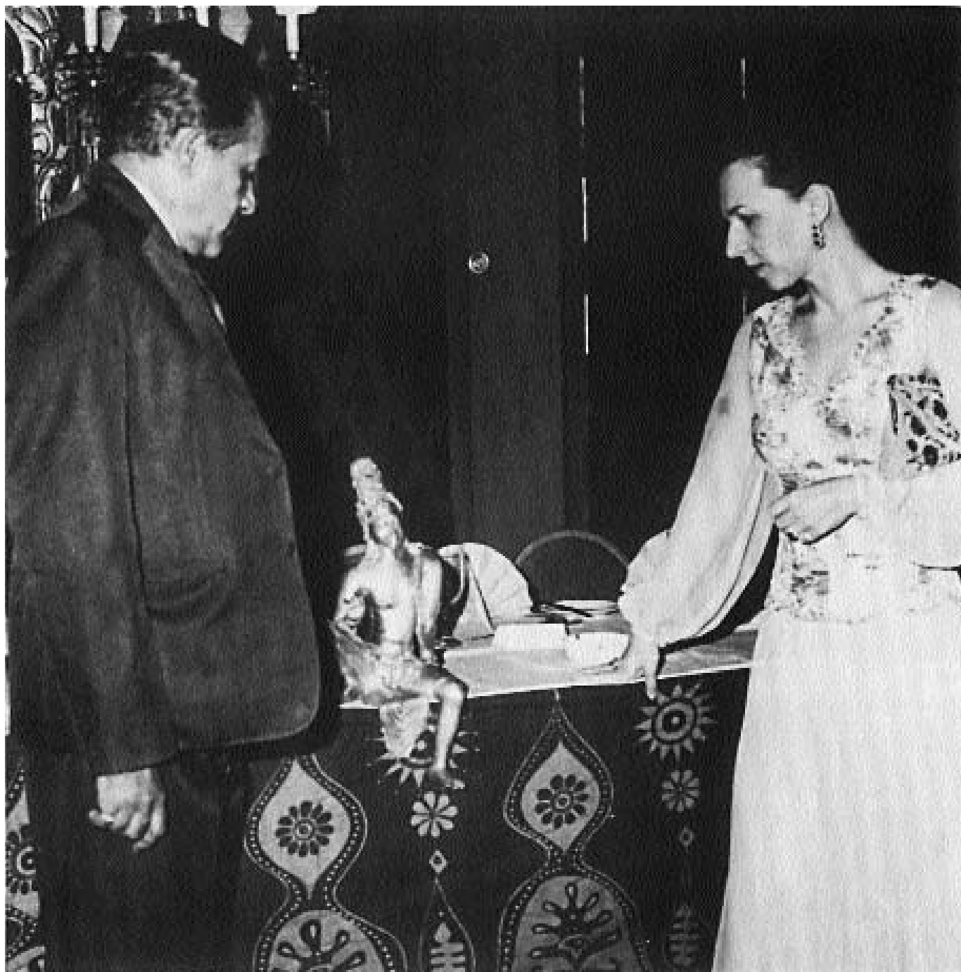
Людмила Живкова с министром культуры Шри Ланки. Коломбо, 1978 г.

ялась «костра» или «креста», а потому, что, пользуясь властным положением, выпавшим на ее долю, хотела успеть донести до людей, чьи сердца были омерщвлены отжившей идеологией, как можно больше идей, в которых были заключены истина и свет, столь необходимые для будущего созидания. Свет красоты, свет культуры, свет любви. Она не была ни проповедником, ни миссионером. Она являлась творцом и подвижником, стремившимся то, что однажды ей открылось, внедрить в жизнь, в ту область, в которой она имела власть и которая еще ей подчинялась. В отличие от других государственных чиновников, которые думали одно, а делали другое, боясь потерять теплое «верх-